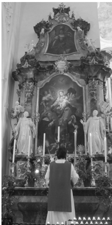
kapel in het Munstertal

Wat is dat toch wat in je wezen doordringt, als het ego even wegvalt, en alles samenkomt, in dit geval mensen van goede wil. De overweldigend mooie natuur van het zwarte woud? Je kunt die staat van zijn niet afdwingen, alleen maar je stil openstellen. Het is altijd maar even, want daarna komt er weer zin in koffie of een andere afleiding.