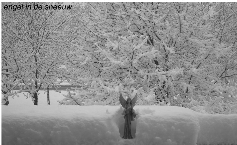
engel in de sneeuw

Het geschiedde: het maagdelijk wit omarmt de beschermengel, vrede op aarde, overal en nergens