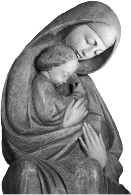
Mariabeeld in Greccio

Het is vooral de warmte die ervan uitstraalt, die je goed doet. Je gedachten gaan dan naar het gebeuren op die avond in Bethlehem. Ook Franciscus heeft zich daarvoor laten leiden.